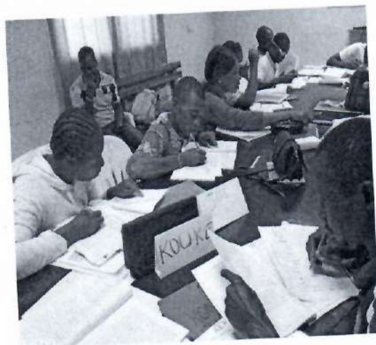
VISITE A DOMICILE BOITE A IMAGE