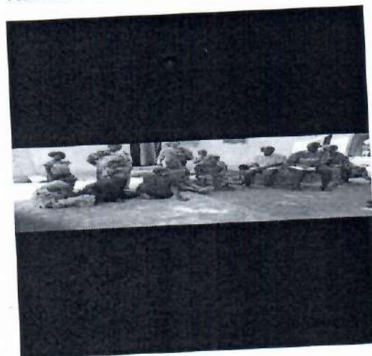
VISITE A DOMICILE SUR LA VACCINATION