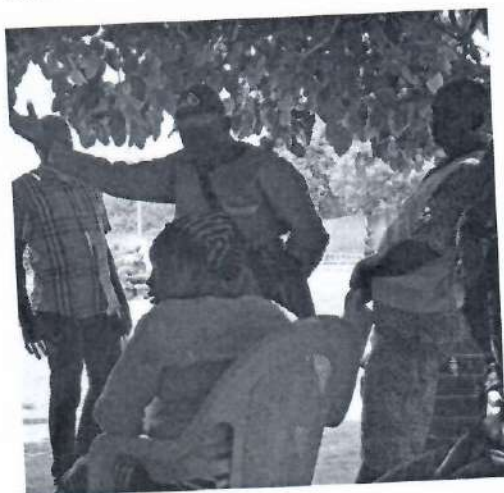
VISITE A DOMICILE SUR LA MILDA